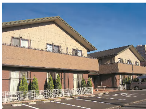
グランマ八王子 全景