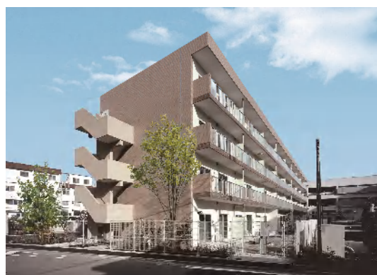
リバーサイド立川 全景