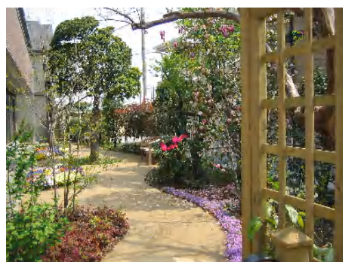
グランマ立川 中庭